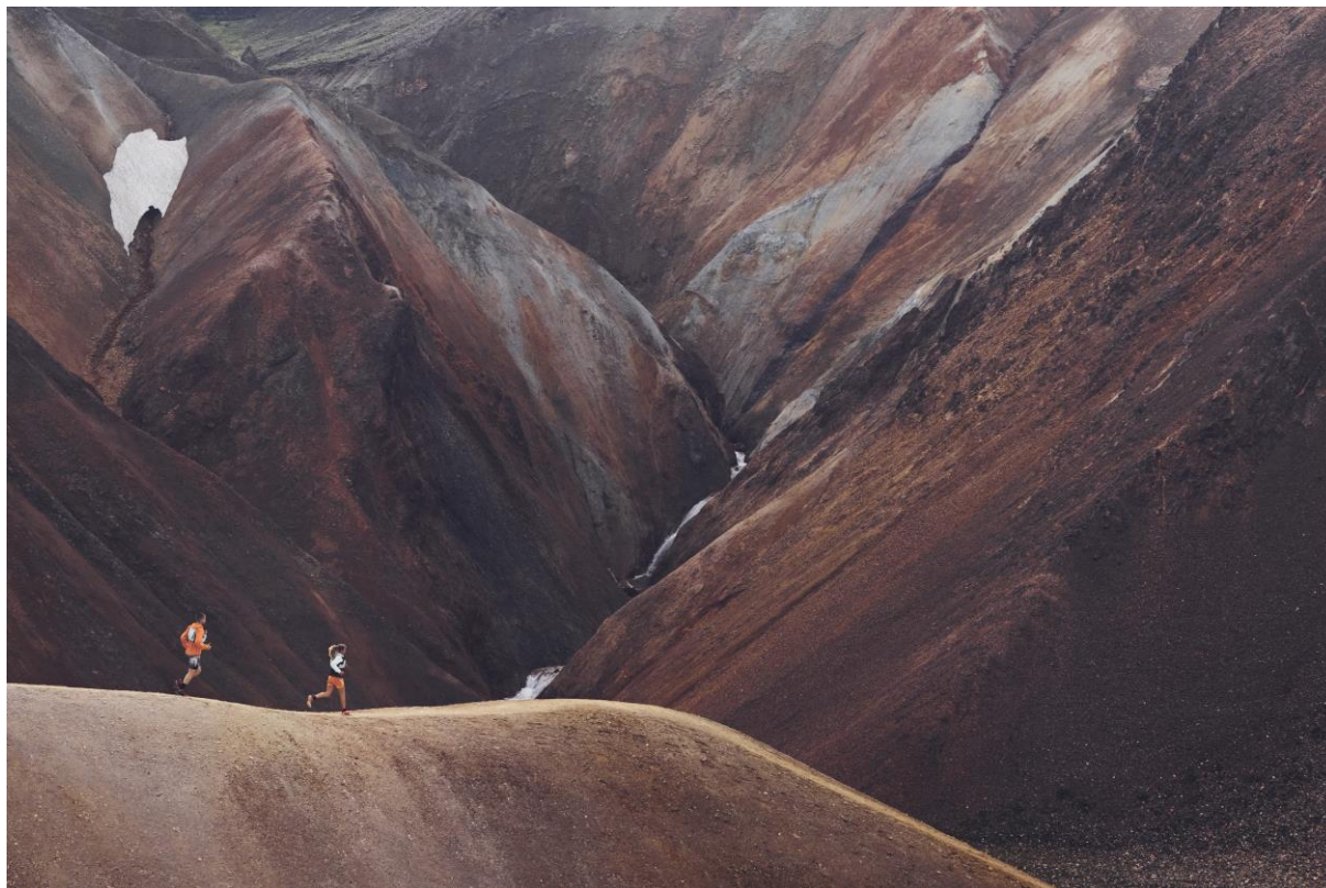
Trailrunning in Island, eingekleidet in die 100 % dekarbonisierte Trail Running Kollektion.

Am 2. Januar 2023 unterzeichnete Mammut mit Climeworks ein «Carbon Dioxide Removal (CDR)» Abkommen, um einen Teil seiner CO 2 Emissionen mittels «Direct Air Capture» Technologie direkt aus der Atmosphäre zu entfernen. Ein bedeutsamer Schritt auf dem Weg zum Ziel Netto-Null bis 2050. Mammut ist das erste Unternehmen in der Outdoorbranche, welches ein Abkommen mit Climeworks eingeht. Damit nimmt das Schweizer Unternehmen eine Pionierrolle ein und positioniert sich an der Front im Kampf gegen den Klimawandel.